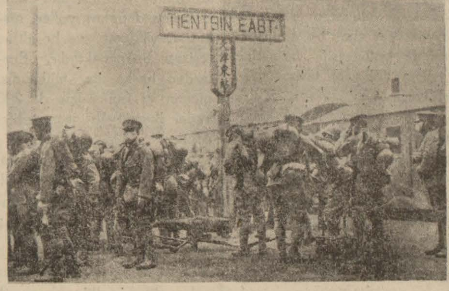
Tien-Çinde Japon küt'aları

Şanghay, 9 (A.A.) — Takung Paodan bildirildiğine göre Tsinan da Japon ve Çin ileri karakolları arasında Tiyençinin şarkisinde şimendüfer hatında hafif müsademeler olmuştur. Çin müfrezeleri şif-