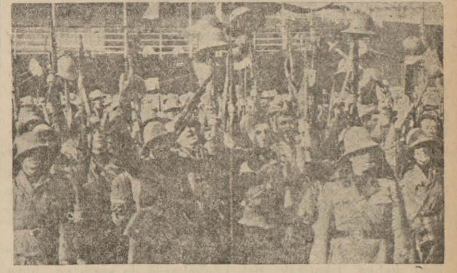
Manevralar münasebetile Misinadaki vaziyet

Mesina, 10 (Radyo) — İtalya Başvekili B. Mussolini, bu sabah buraya gelmiş ve binlerce halk tarafından karşılanmıştır.