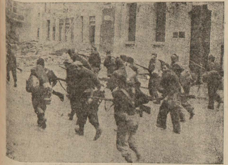
Âsiler esirleri götürürken

Madrid 11 (Radyo) — Cumhuriyetçi İspanya hükümeti, sabık diktator Primo Dörive-ranın esir kızlarını ihtilâlcilere teslim etmişler ve mukabilinde misillerden iki esir zabıt almışlardır.